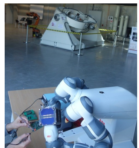
Zusammenarbeit von Mensch und Roboter bei der Integration der Satelliten. Die Anlage zur Simulation der Dynamiktests im Hintergrund.

Die Industrie 4.0-Demonstratoranlage am Zentrum für Telematik in Würzburg zur „Adaptiven Produktion“, die vom Bayerischen Wirtschaftsministerium mit Zielrichtung Automobilzulieferindustrie und mittelständische Industrie etabliert wurde, eröffnet nun besonders gute Möglichkeiten konkrete Tests auch in anderen Einsatzgebieten durchzuführen. So wurde hier die Anwendung für die sich aktuell besonders disruptiv entwickelnde Produktion von Satelliten ins Auge gefasst und für den Wettbewerb vorgeschlagen. Ausgangspunkt ist hier ein modulares Konzept für die einzelnen Untersysteme und mit diesen Bausteinen kann dann gemäß den Anforderungen aus den einzelnen passenden Komponenten ein kompletter Satellit zusammengesetzt werden. Wesentlich ist hier die im Rahmen von UNISEC Europe entwickelte elektrische Schnittstelle, welche die Kombination von Elementen verschiedener Hersteller unterstützt. In Zusammenarbeit zwischen Menschen und Robotern kann dann anschließend eine besonders effiziente und flexible Satelliten-Integration durchgeführt werden. Mit Transportroboterfahrzeugen wird dann die Integration der Bauteile mit der Testumgebung verbunden, so dass nach jedem Integrationsschritt effizient entsprechende Tests durchgeführt werden können, um den hohen Qualitätsansprüchen der Raumfahrt zu genügen.